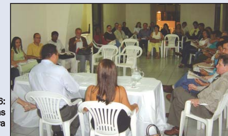
Assembléia realizada em 2006: Associados participam das decisões da cooperativa

Em breve, a cooperativa enviará a circular de convocação e o Relatório de Gestão.